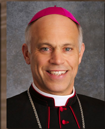
Archbishop Salvatore Cordileone