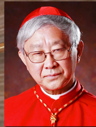
Cardinal Joseph Zen