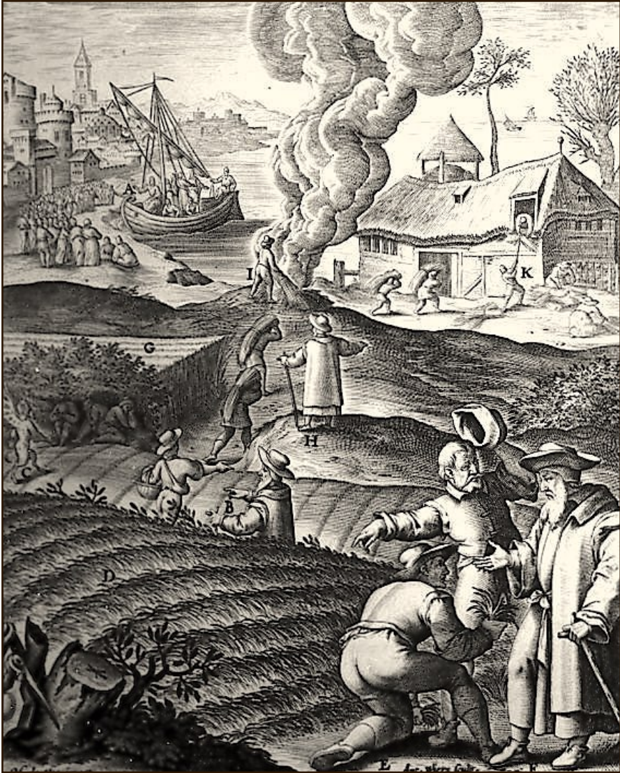
WOODCUT IMAGE - FR JEROME NADAL SJ - 1595